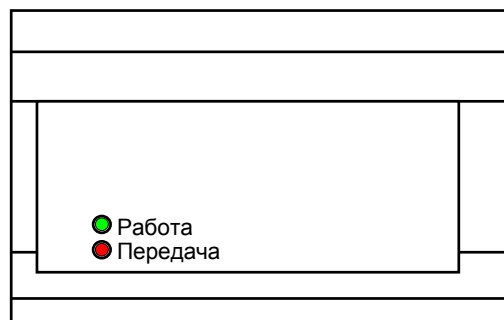
Рис. 1. Внешний вид передатчика (надписи показаны условно)

Замечание. На передней панели корпуса есть кнопка, которая не используется.